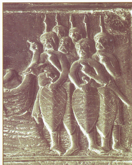
Prusowie (fragment Drzwi gnieźnieńskich)

walk, kiedy w latach 1194-1202 Mieszko Stary panował na przemian z małoletnim synem Kazimierzem, Leszkiem Białym. W kolejnych walkach coraz większą rolę odgrywali możni i biskupi.