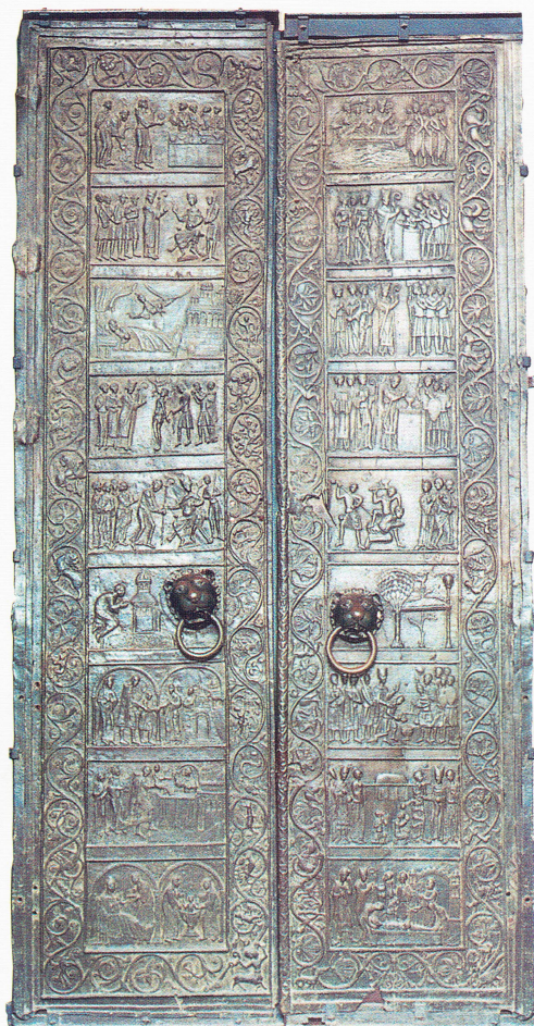
Drzwi gnieźnieńskie z XII w. ze scenami z życia i śmierci św. Wojciecha

W 1138 r. Bolesław Krzywousty testamentem podzielił państwo na dzielnice. Podziałów dokonywano już wcześniej, ponieważ władca uważany był za właściciela państwa i mógł je dzielić między synów. Nowym elementem było sprawowanie władzy zwierzchniej. Księciem-seniorem miał być zawsze najstarszy z Piastowiczów. Uzyskiwał specjalną dzielnicę, której nie przekazywał synom, lecz następnemu seniorowi. Stolicą tej dzielnicy był Kraków. Obejmowała ona ziemię łączyczką, sieradzką, wschodnią Wielkopolskę, część Kujaw i zwierzchnictwo nad Pomorzem, zatem nie pokrywała się z żadną z dawnych dzielnic plemiennych. Kształt jej zmienił się już w XII wieku. W 1144 r. Łęczycę, stanowiącą dożywocie wdowy po Krzywoustym, Salomei, przyłączono do Mazowsza, w 1146 r. Kalisz i Gniezno do Wielkopolski, a w 1166 r. ziemia wiślicka stała się dzielnicą dziedziczną Kazimierza Sprawiedliwego.